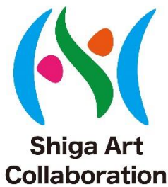
「滋賀県アートコラボレーション事業」のロゴマーク