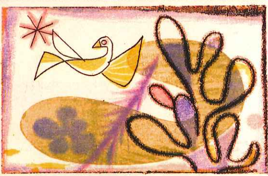
「サンライズ・カレンダー部分 / 1957」